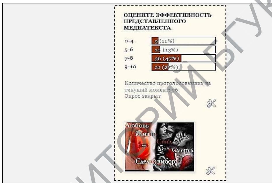
Рис. 3. Обсуждение выполненных заданий в ЭМО «Информационные технологии в культуре»

Обсуждение выполненных заданий организовано в виде опросов и комментариев, которые контролирует преподаватель. Обсуждение созданного студентом медиатекста, содержащего графику, представлено на рис. 3.