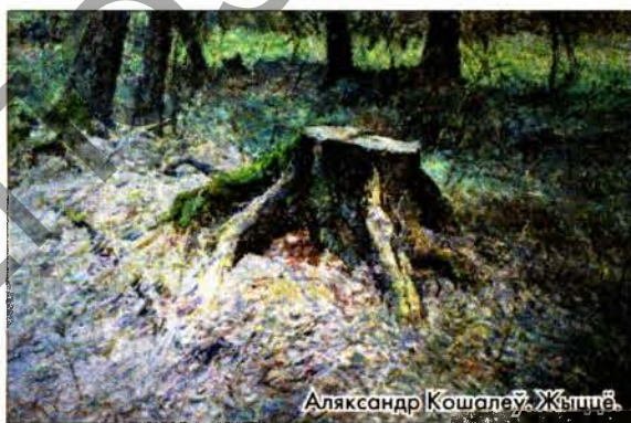
Аляксандр Кошалеў. Жыццё.

вай тэмай "Культурная дыпламатыя Рэспублікі Беларусь", якая распрацоўваецца на кафедры. Рэалізацыя гэтай тэмы разлічана на 2016—2020 гады. За гэты час навукоўцы павінны будаць прайсці 5 этапаў. 2016 год быў прысвечаны патэнцыялу культуры Беларусі ў працэсе інтэнсіфікацыі міжнародных адносін, у 2018 годзе ў цэнтры ўвагі даследавання будаць цывілізацыйныя асновы беларускага грамадства ў кантэксце міжкультурнага дыялогу, у 2019 годзе будзе праведзены аналіз асноўных кірункаў і форм прасоўвання дасягненняў беларускай культуры на міжнародным узроўні, у 2019 годзе будаць разгледжаны геацывілізацыйныя перспектывы Рэспублікі Беларусь