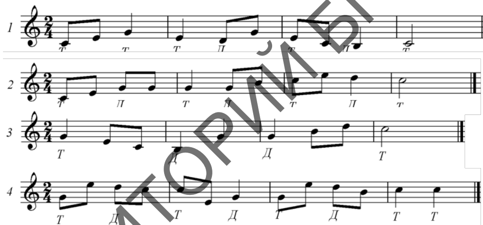
Пример 2.7 – Упражнения, основанные на звуках тонического и доминантового трезвучий

Необходимо рассматривать возможность различных вариантов гармонизации мелодии (пример 2.7):