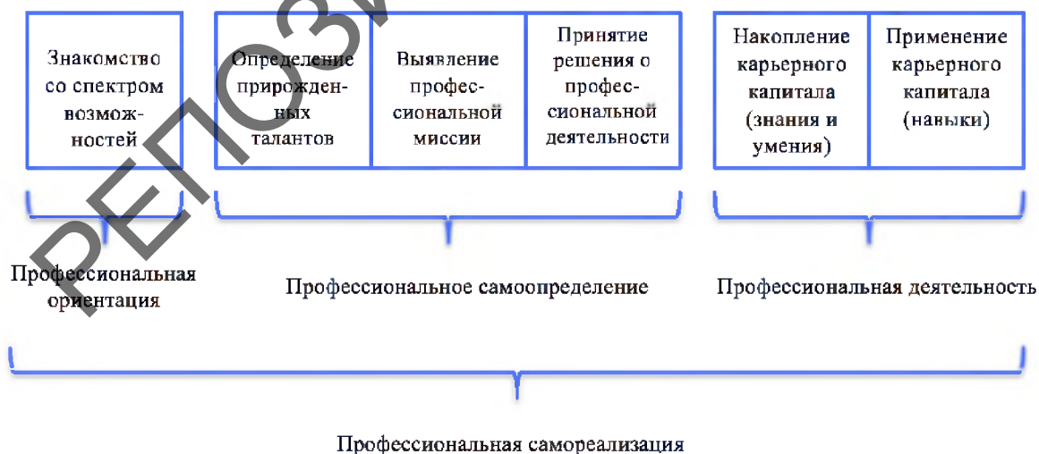
Рис. 1 – Процесс профессиональной самореализации

Представим этот процесс в виде следующей схемы: