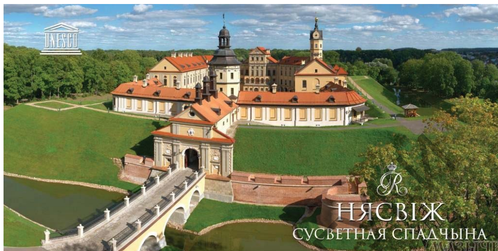
Несвижский дворец Радзивиллов