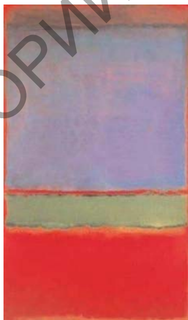
Марк Ротко и его картины «Оранжевое, красное, желтое» (1961 г., продана в 2012 г. за 86,9 млн дол. на аукционе Christie's), «Фиолетовое, зеленое и красное» (1951 г., продана в 2014 г. за 186 млн дол. на частных торгах)