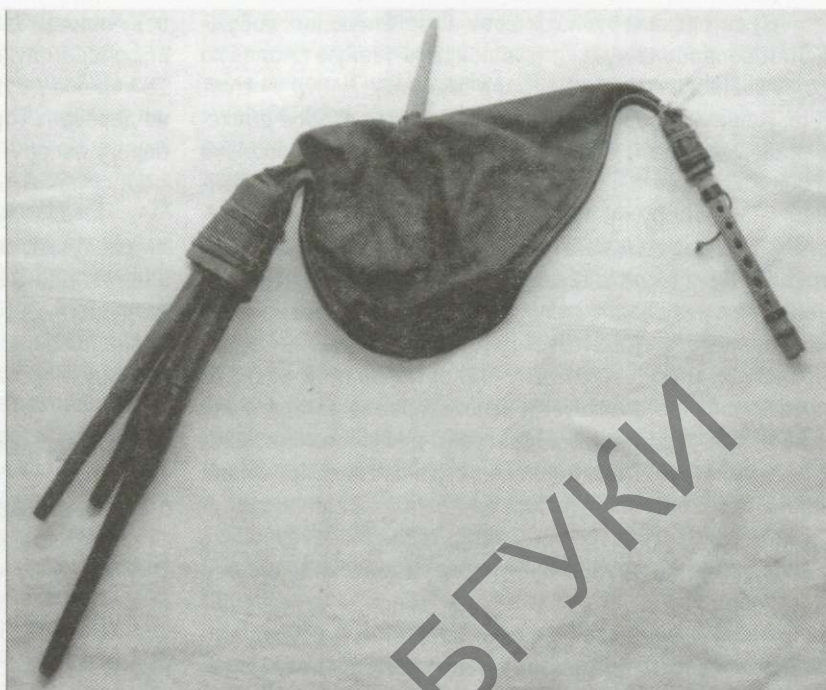
Рис. 2. Многобурдонная белорусская дуда-матянка. Начало XX века

Деревянные части волынок темного (вероятно, черного) цвета. Оба инструмента — так называемые «одногукковые» (с одним бурдоном). Роговни (насадки на игровых трубках) — закругленной формы: в одном инструменте — округлой сферической формы, в другом — более вытянутой «клюшкоподобной» формы. Форма роговней составляет своеобразный ансамбль с формой меха: в первом инструменте: «шейка» воздушного мешка (которая «ведет» к жалейке) короткая, в другом — более длинная. Все деревянные части довольно тонкой обработки — поверхность гладкая, почти полированная. Инкрустация металлом, как на известной волынке из Лепельского музея Витебской области, отсутствует. Роговень жалейки и бурдона инструмента обиты по краю металлическими гвоздями с декоративными шляпками. Подобный тип украшения роговня бурдона ранее в научной литературе не фиксировался, хотя упоминался в устных сообщениях носителей региональной фольклорной традиции и, вероятно, был характерен для белорусского Подвинья. Первый инструмент металлических украшений не содержит, в отличие от второго — сравнительно небольшого и хорошо инкрустированного. Второй инструмент выглядит более колоритно, празднично и легковесно, чем более крупный первый — стильный, аскетичный и основательный. Кстати, эти характеристики в полной мере присущи и хозяевам инструментов — исполнителям на дудах. Каков дударь — таков и инструмент!