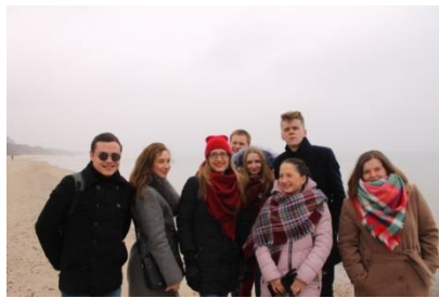
Малюнак 2 – Гурт «Страла» на ўзбярэжжы Балтыйскага мора, Польшча, 2018