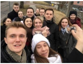
Малюнак 1 – Студэнты I, III і IV курсаў на ўзбярэжжы Балтыйскага мора, 2018