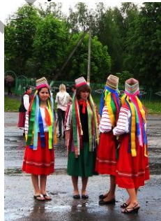
Школьніцы з Неглюбкі