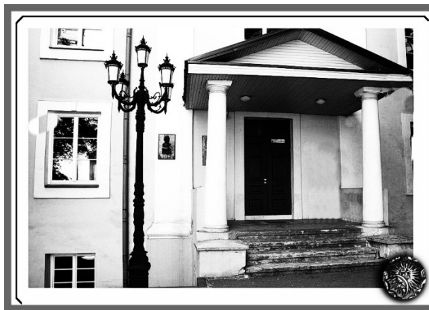
Малюнак 4 – Сучасны выгляд ганка колішняй Беларускай гімназіі, Вільнюс, 2018

Ад пачатку руху па падрыхтоўцы адкрыцця беларускай гімназіі ў Вільні – да святкавання 100-годдзя гімназіі (2019) Беларусь прайшла шмат сур’ёзных выпрабаванняў (дзве сусветныя вайны, атрымала статус афіцыйнага сябра ААН, стала суверэннай краінай), а этнакультурны асяродак у Вільні, аб стварэнні якога рупіліся браты Луцкевічы, працягвае існаваць дагэтуль. Магчыма таму, што ў сваіх адукацыйна-мастацкіх пачыненнях яны арыентаваліся хутчэй на культуру (мысленне і паводзіны, перадаваемыя ў спадчыну), а не на мастацтва (стварэнне творчага прадукта на продаж) ды фармальны піяр (рэкламу, замену зместу дзейнасці дэкларацыямі і слоганамі).