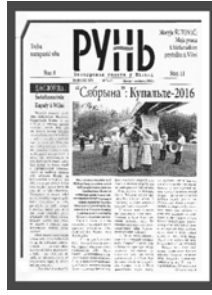
Малюнак 8 – Артыкул пра Купалле клуба беларусаў «Siabrupa», Вільнюс, 2016