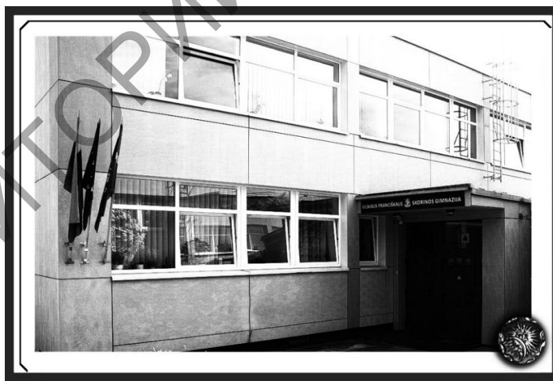
Малюнак 6 – Сучасны выгляд ганка Вільнюскай гімназіі імя Ф. Скарыны, Вільнюс, Sietino gatvė-21, 2018.

Сёння Вільнюскай гімназія імя Францішка Скарыны (Vilniaus Pranciškaus Skorinos gimnazija) – адзіная навучальная ўстанова па-за межамі нашай краіны, у якой можна атрымаць поўную сярэднюю адукацыю на беларускай мове. Тут вучацца каля 200 гімназістаў пераважна беларускага і рускага паходжання, працуюць амаль паўсотні выкладчыкаў. Гімназія (мал. 6) падтрымлівае сувязі з аб'яднаннямі, арыентаванымі на каранёвае мастацтва нашага народа, таму людзі, якія пераймаюць яго па спрадвечна аўтэнтчных правілах – метадам дэманстратыўнай антрапатэхнікі – жаданыя госці ў ёй. Справа ў тым, што 100-гадовы досвед захавання ўласнай супольнасці ў мультикультурным асяродку Вільні (дзе цягам XX стагоддзя перыядычна прэтэндавалі на грамадска-культурнае дамінаванне палякі, габрэі, летувісы, а апошнія ў выніку, як вядома, перамаглі) дае магчымасць параўнання патэнцыялу формы і зместу якой заўгодна культуры ў доўгачасовай перспектыве. Педагагічны калектыў і гімназісты, сярод якіх захавалася ментальнасць аўтэнтчнага мясцовага беларускага культурнага асяродку – спрактыкаваныя і ўважлівыя гледачы, якія заўжды адрозняць сапраўднае паглыбленне ў традыцыю, яе змест, ад – павярхоўнай (арыентаванай на форму) імітацыі народнага мастацтва. Магчыма, таму кафедра этналогіі БДУКМ, яе студэнты і выпускнікі ўжо больш за дзесяцігоддзе запрашаюцца на галоўныя святы беларусаў – Каляды (мал. 7) і Купалле (мал. 8) – адміністрацыяй і супрацоўнікамі гімназіі, заснаванай некалі братамі Луцкевічамі.