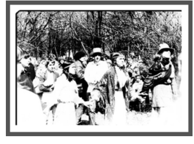
Малюнак 10 – Гуканне вясны ўдзельнікамі аб'яднання «Майстроўня», Мінск, 1983 [2, с. 147]

Варта адзначыць, што беларускі этнакультурны асяродак, захаваны ў Вільнюсе ад часоў актыўнасці Луцкевічаў не быў «самазамкнёны»: на мяжы XX–XXI стагоддзяў ён неаднойчы ўваходзіў у кантакт з суполкамі і асобамі, ахоўваючымі этнакультуру ў самой Беларусі, тым больш, што, як не парадаксальна, лёс апошніх на Радзіме не заўжды быў трыумфальным і бесперашкодным. Мультикультурнасць мае і станоўчыя, і адмоўныя моманты: калі ў сучаснай Літве афіцыйна фігуруюць у статыстычных справах на перапісам насельніцтва каля 200 этнасаў, то ў Беларусі іх каля 100, што – таксама нямала. А геапалітычнае становішча краіны «праграмуе» ў ёй перманентную барацьбу нацыянальных інтарэсаў, што фарміруюцца ды ідуць як з Усходу з Захадам, так і з унутраных мясцовых дыспар. У выніку патрыётам Беларусі, асабліва «на пераломных» момантах яе гісторыі, ва ўласнай краіне не заўжды камфортна і ўтульна, а адзін з магчымых напрамкаў перасоўвання асобы ў такім выпадку – Вільнюс.