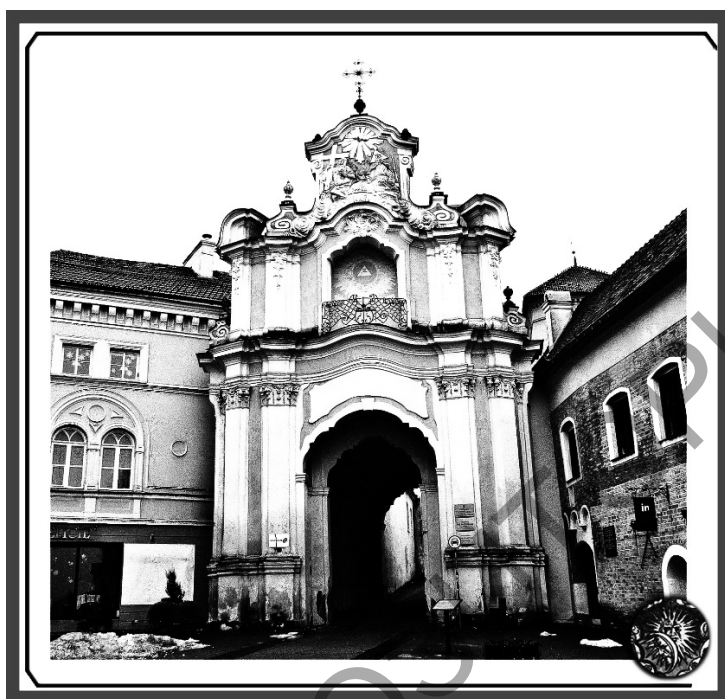
Малюнак 1 – Брама колішніх Базыльянскіх муроў, Вільнюс, Aušros Vartų gatvė-7 В, 2018

Па трывалай традыцыі ў студзені бягучага 2019 года студэнты і выпускнікі кафедры этналогіі і фальклору Беларускага дзяржаўнага ўніверсітэта культуры і мастацтваў (БДУКМ), якія доўжаць творчыя сувязі са сваёй alma mater удзелам у канцэртах і перформансах ансамбля беларускай музыкі «Талака», наведалі Вільнюскую гімназію імя Францішка Скарыны, каб напярэдадні 100-годдзя гэтай навучальнай установы адсвяткаваць з яе навучэнцамі і выкладчыкамі Зімовыя Святкі.