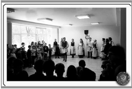
Малюнак 7 – Каляды ў гімназіі імя Ф. Скарыны, Вільнюс, 2019.