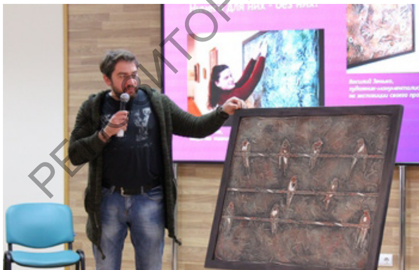
Участники мероприятий по реализации международного проекта «ОбРаз – образование и развитие инклюзивного искусства» (2019–2020 гг.)