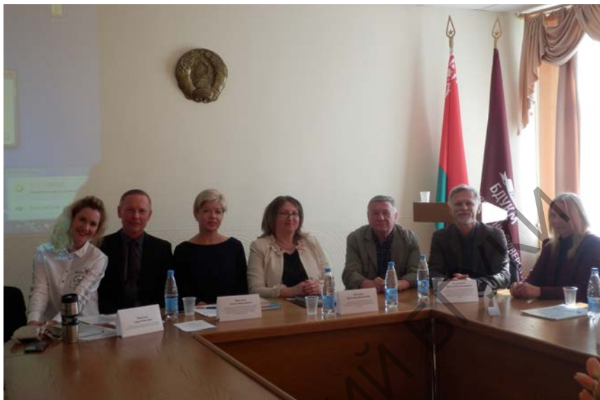
Участники республиканского круглого стола «Методы реализации творческого потенциала личности в учреждениях образования в сфере культуры». ИПКиПК, 24 сентября 2020 г.