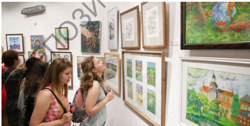
Республиканская выставка творческих достижений учащихся детских школ искусств Беларуси в художественной галерее «Университет культуры»