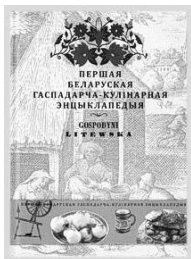
Малюнак 1 – Перавыданне «Gospodyni litewska...» Мінск, 2012