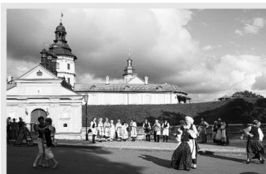
Малюнак 2 – Інтэрактыўныя танцы і адпачынак на арт-фэсце «Тэатр Уршулі Радзівіл у Несвіжскім замку». Грае – фальклорны гурт кафедры этналогіі і фальклору БДУКМ «Раме» (курс В. Калацэя), танчаць і адпачываюць – гурт «Страла» (курс Э. Шадрыной). Нясвіжскі палацава-паркавы комплекс, 2012