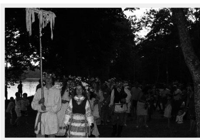
Малюнак 5 – Купальскае шэсце разам з адпачываючымі ў санаторыі. Свіцязь, 2012