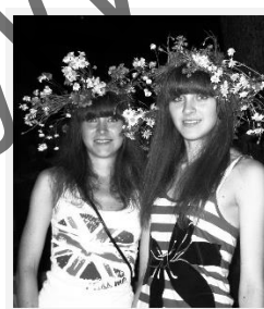
Малюнак 7 – Удзельніцы Купалля з санаторыя. Свіцязь, 2012

Я спадзяюся, Энгельс Канстанцінавіч шчыра ганарыўся намі, асабліва тым, што мы – студэнты кафедры этналогіі і фальклору (якім ён на лекцыях па тэарэтычных дысцыплінах старанна тлумачыў, як змагаліся за лёс народаў, культуру якіх вывучалі, выбітныя еўрапейскія і амерыканскія антрапалагі) – пасля заканчэння навучання ва ўніверсітэце, атрымання дыпламаў спецыяліста па фальклору і далей працягваем займацца народнай творчасцю, перадаём павагу і любоў да беларускай песні, традыцыйнай культуры іншым людзям. Ён вучыў не прымаць памылковыя стэрэатыпы, што праца фалькларыста – апісаць і здаць у архіў, а перад усім спрыяць перайманню і жыццю таго, што фалькларыст вывучае.