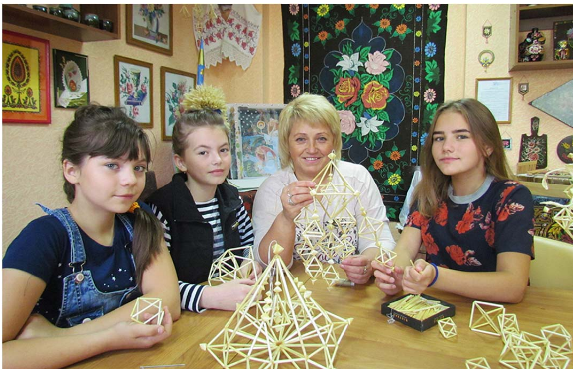
Рис. 6. Образцовая студия декоративно-прикладного творчества «ДАР» (рук. – И. Г. Кухтина)