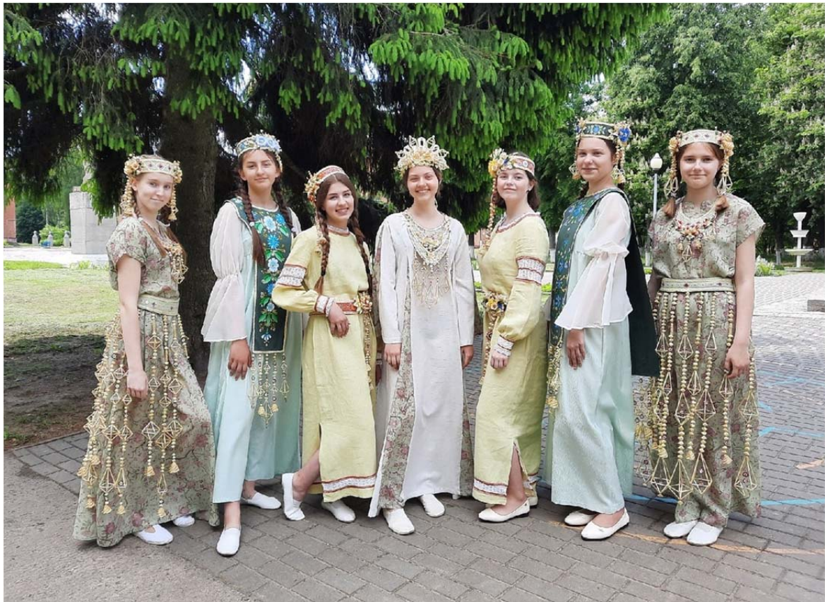
Рис. 8. Коллекция костюмов и головных уборов (итоговое мероприятие региональной инициативы «Мобильная школа авторского ремесла», 2021 г.)