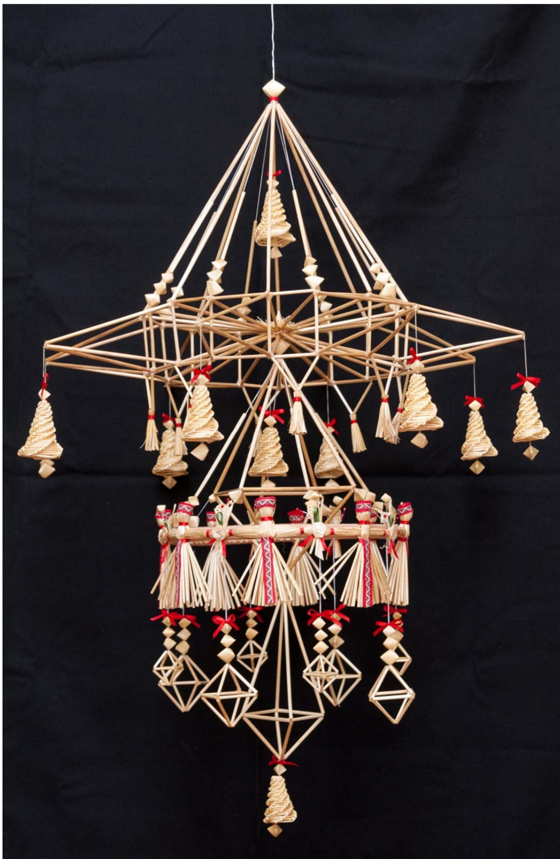
Рис. 4. Праздничный соломенный паук «Купалье» (2018)