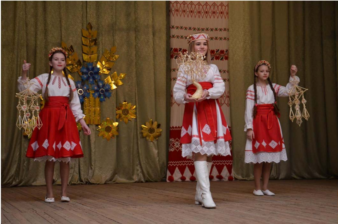
Рис. 10. Региональный фестиваль декоративно-прикладного искусства «Соломенный паук» (2020)