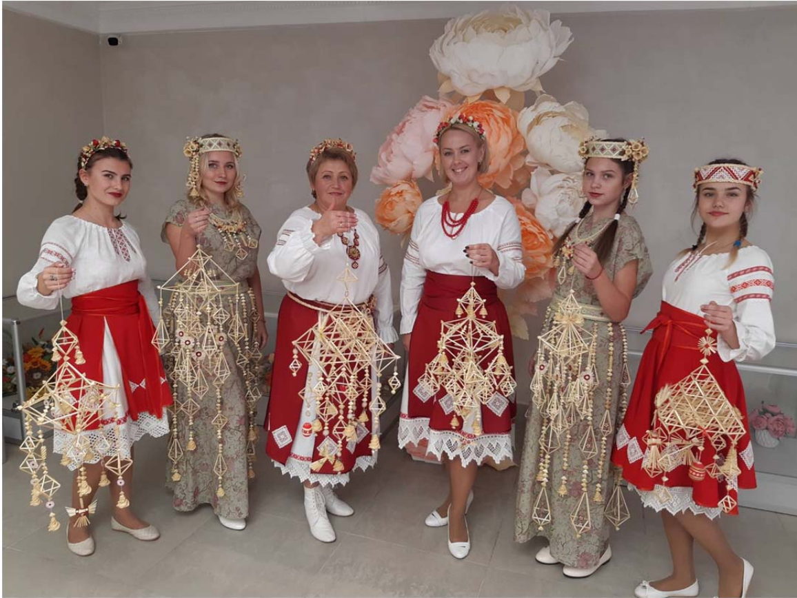
Рис. 5. Участники студии декоративно-прикладного искусства «Призвание» (рук. – И. Г. Кухтина)