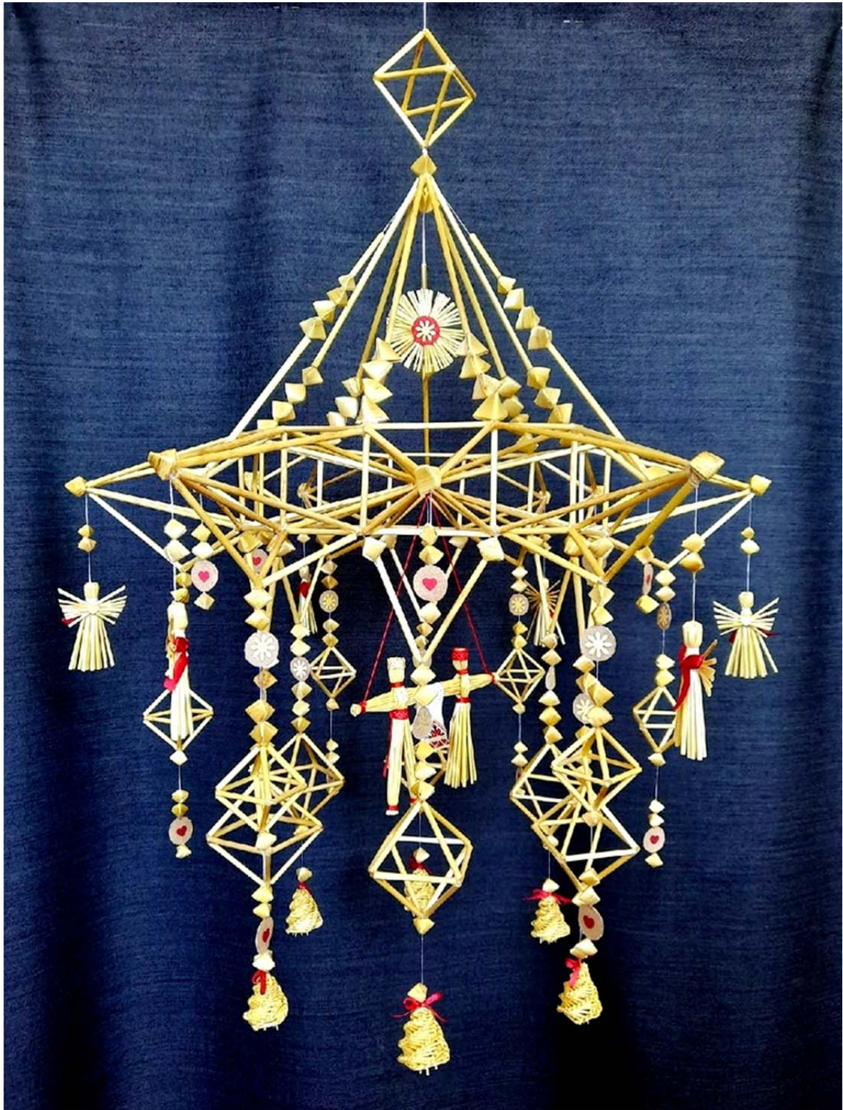
Рис. 3. Соломенный паук календарных праздников (2020)