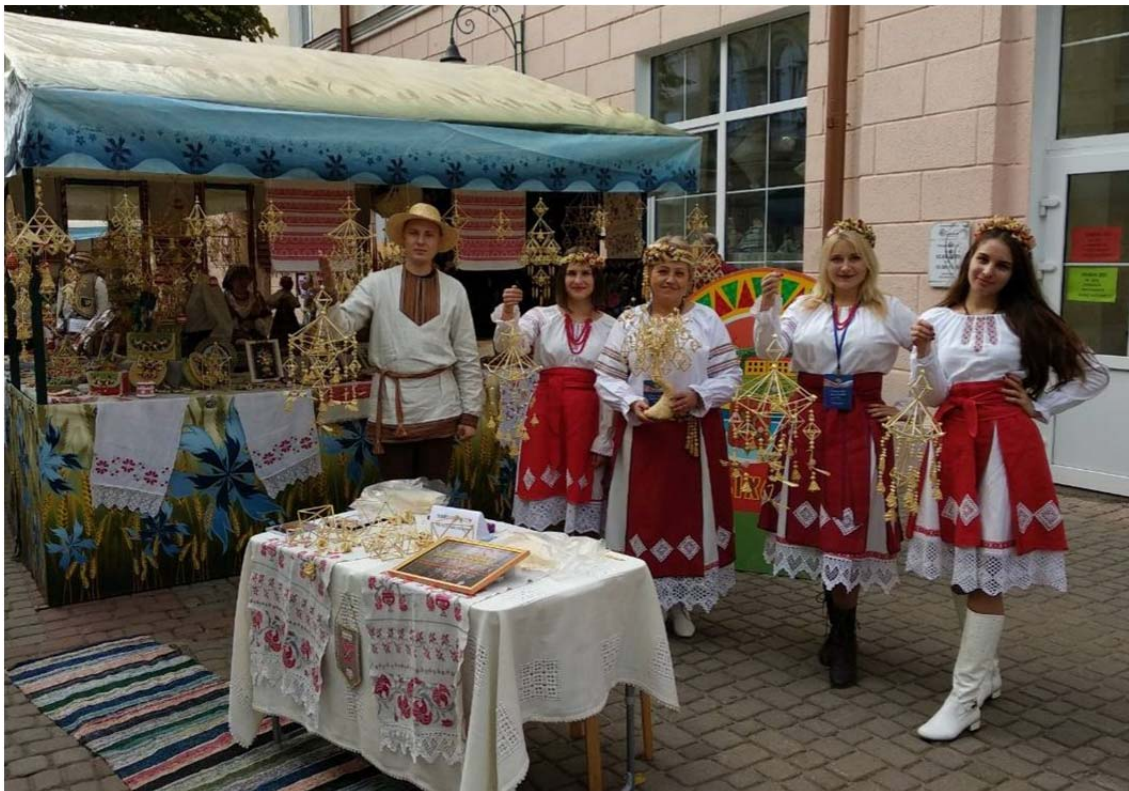
Рис. 9. Выставка-ярмарка ремесел «Город мастеров» на V Форуме регионов России и Беларуси (2018)