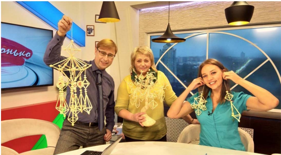
Рис. 11. Участие в программе «Ранёхонько» (2018)