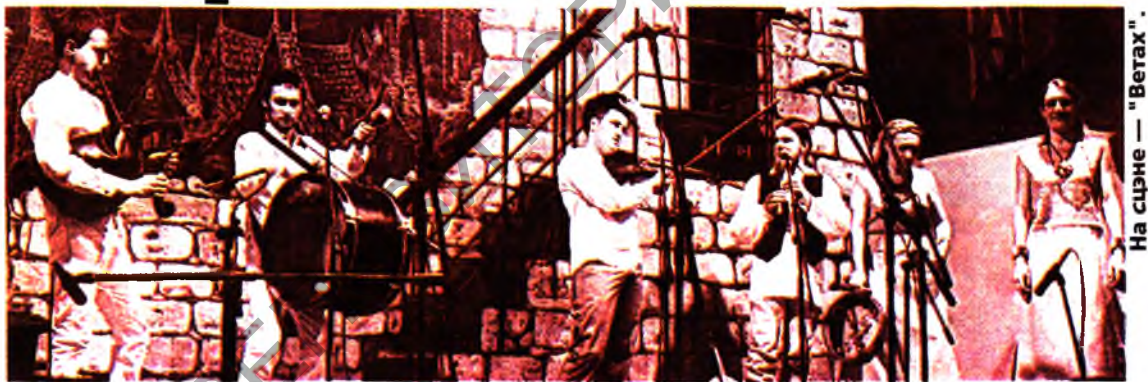
На сцэне — "Ветах".

Рэмішэўскі. На відэакадрах можна пабачыць двух свіх дудароў, што выконваюць найгрыш, па якім адсочваецца страчаная манера ігры на беларускай валынцы — дудзе. Гэта — адзіны ў свеце відэадакумент аўтэнтычнай беларускай дударскай традыцыі, прымым прад'яўлены ХХІ стагоддзю менавіта навуковай імпрэсай БДУКІМ.