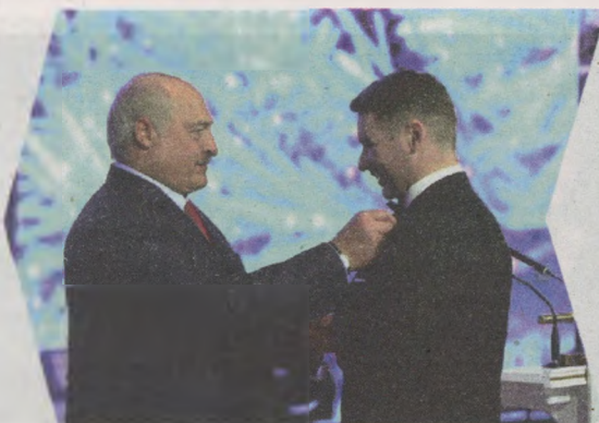
Урачыстае ўзнагароджанне медалём імя Ф. Скарыны, 2023 г.

Прымае ўдзел ва ўкраінскіх тэлевізійных шоу "Голас краіны" (2013), двойчы ў музычным шоу талентаў "Х-фактар" (2015, 2017). З'яўляецца ў праектах і на беларускім тэлебачанні. Напрыклад, у перадачы аб фальклорнай спадчыне Беларусі "Наперад у мінулае". У 2016-м удзельнічае ў першай у Беларусі "Бітве вядучых", дзе займае другое месца. Працягвае развівацца на гэтай ніве.