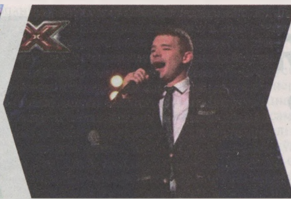
Падчас выступу на "Х-фактар", 2017 г.