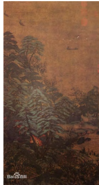
Ли Чжаодао. Терем под парусом на реке

Монохроматическая живопись шуймо – одно из направлений китайской живописи, которая в основном развивалась в виде салонного искусства. Этот жанр основан на тонкой технике кисти и туши. Тушь, используемая в жанре шуймо, бывает пяти видов: густая, жидкая, обожженная, сухая и сырая. Она используется для изображения на картине перспективы, соотношения переднего и заднего плана. Испокон веков монохроматическая живопись тушью была способом выражения чувств образованных людей, отображением их взглядов на общество, человеческую жизнь, судьбу, природу. Развитие живописи от династии к династии, от эпохи к эпохе можно проследить в процессе развития шуймо, поскольку этот жанр был основным в китайской живописи, подарив миру искусства много великих