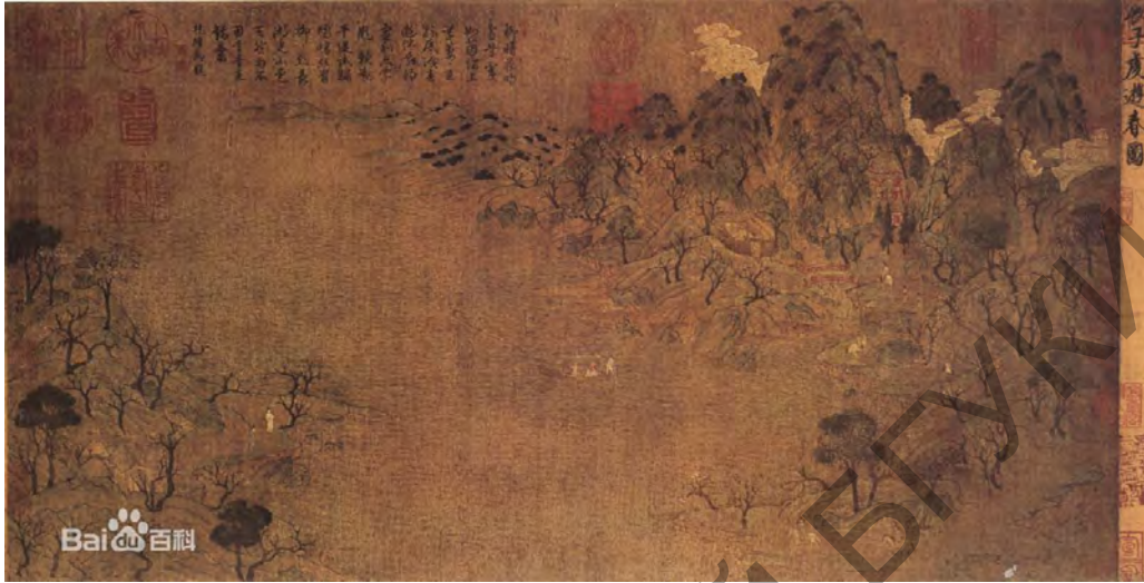
Чжань Цзыцянь. Вясенняя прогулка

саблываюцца, сфарміраваліся ў самастойны жанр – шань-шуй. Первым пейзажам у жанры шань-шуй лічыцца карціна «Вясенняя прогулка» Чжань Цзыцяня эпохі дынастыі Суй.