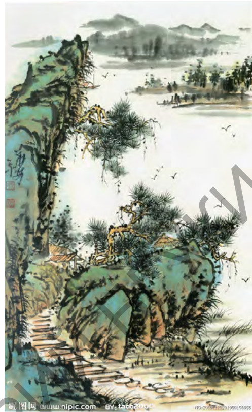
Пример малого цинлюй

Жанр малого цинлюй основывается на циньцзянь цинлюй с добавлением малахита и лазурита, в нем возможно использование двух видов туши: на сосновом угле и масле. Для малого цинлюй характерны легкие краски, прозрачность, сочность. Вначале при помощи линий тушью намечаются контуры гор, затем штриховкой косо поставленной кисточкой изображаются изменения горного ландшафта: в основании гор слегка подмешивается тушь, чтобы выделить светотень вогнутых и выпуклых поверхностей. Затем при помощи светло-зеленого и индиго окрашиваются осветленные участки горы. Когда светло-зеленый и индиго высохнут, смешиваются малахит и лазурит, которые покрывают картину вторым слоем. Все минеральные краски используются лишь слегка, наносятся тонким слоем, затем, пока они еще влажные, травянисто-зеленым и индиго обрисовываются контуры горы и светотень, чтобы достичь более четкого и глубокого эффекта.