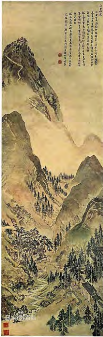
Чжан Хун. Изгиб долины, шелест ветра в соснах. Эпоха династии Мин

На рубеже династий Северной и Южной Сун происходило формирование цзиньби шань-шуй, большого и малого цинлюй. На протяжении династий Юань, Мин и Цин они самостоятельно развивались, оказывая влияние друг на друга, но наибольший успех приобрела манера малого цинлюй. Особенности цзиньби (золотисто-бирюзовый) шань-шуй являются великолепие и блеск золотых оттенков, в большом цинлюй акцент делается на яркость и четкость, тогда как красота малого цинлюй кроется в мягких тонах. Произвольная манера цинлюй возникла в конце эпохи Мин, ее ярким представителем был Лань Ин, творчество которого отличали бесконтурная манера письма и наложение многократных слоев красок. Впоследствии на основе его живописи вырос современный «цинлюй с брызгами», представленный творчеством таких художников, как Чжан Дацянь, Лю Хайсу и др. Для бесконтурного наложения красок характерны красочность, беспорядочность, хаотичность, тогда как для цинлюй с брызгами – пылкость, воодушевленность, страстность. Художники, писавшие в манере цинлюй с брызгами, – Чжань Цзыцзянь, Ли Сысюнь, Чоу Ин, Чжан Хун и др.