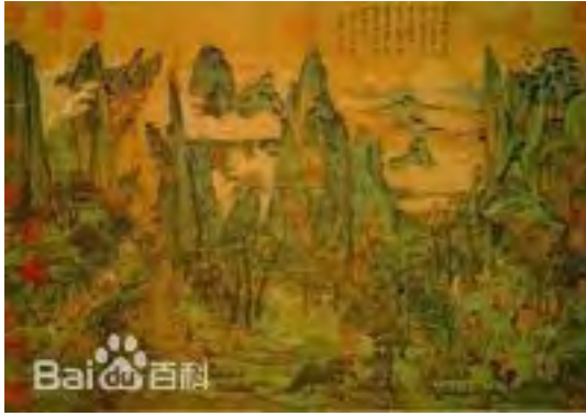
Ли Чжаодао. Император Мин направляется в счастливое царство Шу

В начале эпохи династии Тан жанр шань-шуй находился в состоянии упадка, но с расцветом династии последовал его взлет. В это время творили такие известные художники, как Ли Сысюнь, Ли Чжаодао.