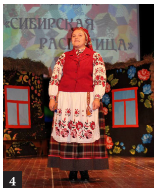
4, 5. Первый молодежный фестиваль-конкурс «Сибирская распутица»