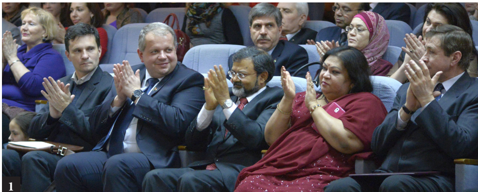
1. Праздничный вечер в БГУКИ, посвященный 65-летию создания Индийского совета по культурным связям

организациями, творческими союзами, художественными коллективами и исполнителями стран ближнего и дальнего зарубежья.