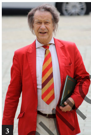
3. Народный художник СССР А. М. Шилов