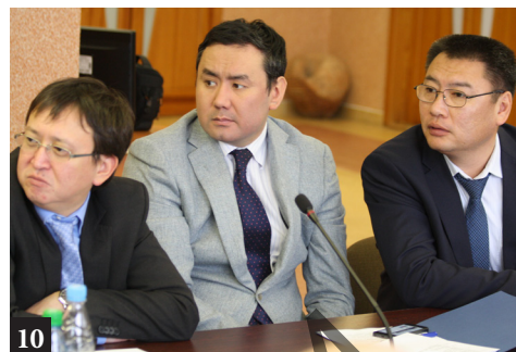
9, 10. Міжнародны круглы стол «Казахстан–Беларусь»