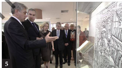
5. Адкрыццё ў Нацыянальнай бібліятэцы Беларусі выставы выданняў Ф. Скарыны са збораў бібліятэкі Верхнялужыцкага навуковага таварыства (Гёрліц, Германія), 2012 г.

У той жа час рэальнае вяртанне першадрукаў Ф. Скарыны і яго паслядоўнікаў магчыма ў вельмі абмежаваным маштабе. У такой сітуацыі неабходна ажыццяўленне альтэрнатыўных мерапрыемстваў па вяртанні кніжнай спадчыны ў навуковы і грамадскі ўжытак беларусаў і іх еўрапейскіх суседзяў. Адным з такіх шляхоў уяўляецца часовае вяртанне арыгінальных выданняў у Беларусь у час кніжных выстаў і іншых мерапрыемстваў. Такую практыку ўпершыню распачала Нацыянальная бібліятэка Беларусі ў 2012 г. выставай адзінаццаці пражскіх выданняў Бібліі Ф. Скарыны са збораў бібліятэкі Верхнялужыцкага навуковага таварыства (Гёрліц, Германія). Падобныя выставы з замежных збораў запланаваны на бліжэйшыя гады.