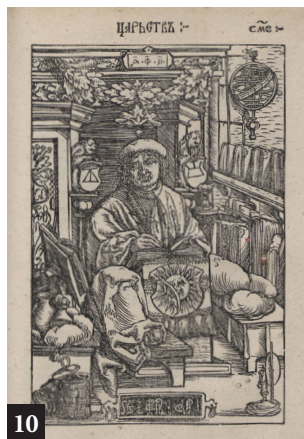
10. Партрэт Ф. Скарыны з выдадзенай ім Чацвёртай кнігі Царстваў

каў. Што і казаць, калі нават спадчына Францыска Скарыны дагэтуль не перавыдадзена ў поўным аб'ёме. Такое ўзнаўленне павінна быць выканана на найвышэйшым паліграфічным узроўні ў адпаведнасці з актуальнымі магчымасцямі нацыянальнага і сусветнага кнігавыдання.