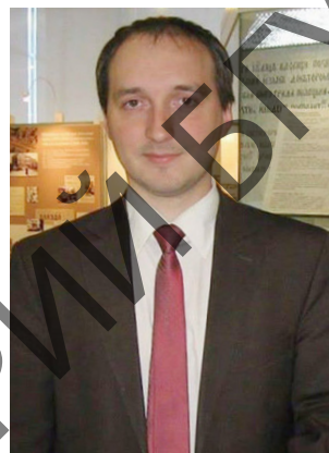
Аляксандр Аляксандравіч Суша

Пры ўсёй шматбаковасці сваёй дзейнасці Аляксандр Пётрашкевіч вядомы большасцю сучаснікаў як аўтар двух драматычных твораў, аб'яднаных агульнай тэмай і адным галоўным героем –