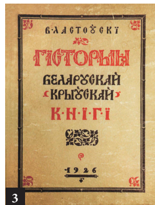
3. «Гісторыя беларускай (крыўскай) кнігі», выпушчаная В. Ластоўскім да 400-годдзя беларускага кнігадрукавання

Праца ў гэтым напрамку вядзецца ўжо даволі даўно. Так, у межах гэтай дзейнасці Нацыянальнай бібліятэкай Беларусі быў набыты шэраг рэдкіх і каштоўных кніг. Сярод іх: выданні знакамітай працы Казіміра Семяновіча «Вялікае мастацтва артылерыі» (1650, 1651, 1676, 1729), старажытны беларускі «Псалтыр» (Вільня, 1782), «Жыцця святых» Дзмітрыя Растоўскага з самай старажытнай графічнай выявай Магілёва (Магілёў, 1702), унікальная калекцыя старажытных беларускіх карт і інш. Найбольш