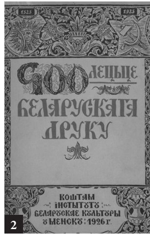
2. Юбілейнае выданне зборніка «Чатырохсотлеце Беларускага друку», выпушчанага Інстытутам Беларускай культуры ў 1926 г.

Вельмі пышна і пафасна адзначаўся таксама юбілей 450-годдзя беларускага кнігадрукавання ў 1967 г. Вялікія святочныя мерапрыемствы прайшлі ў Мінску (найперш у Акадэміі навук БССР) і ў Полацку.