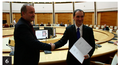
6. Падпісанне ў друк першага тома поўнага факсімільнага ўзнаўлення кніжнай спадчыны Ф. Скарыны, 2013 г.