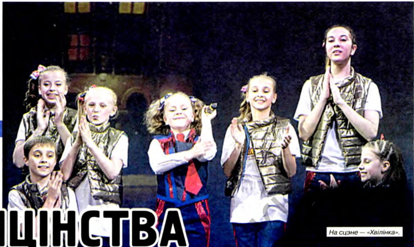
На сцэне — «Хвілінка».

Вось і зараз, працягваючы накопліваць такія творчыя сонечныя хвілінкі, юныя артысты не спяшаюцца разыходзіцца на канікулы. Плануюць будучы канцэртны сезон, сумесны канцэрт з даўнімі сябрамі «Хвілінкі» — заслужаным артыстам Беларусі спеваком Уладзімірам Правалінскім