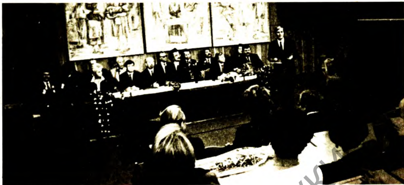
Пасяджэнне Рады Беларускага ўніверсітэта культуры