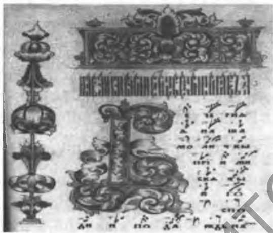
图1 传统的文字手稿

韦特卡博物馆的弯钩记谱法手稿书大多属于传统牧师老信徒,这些手稿古迹中可见古俄罗斯和古白俄罗斯艺术书籍装饰特点,并且与韦特卡艺术学派书籍装饰又具有不同,典型的多彩性如绿色、蓝色、红色和黄色的使用,韦特卡工匠使用装饰的元素有首字母和文字、封皮、袖珍图画。经常在书籍装饰中可见金漆,给书本赋予充满节日性的装饰。韦特卡手稿书籍也极富民间艺术特点,色彩鲜艳明亮,充满欢快能量,令人惊叹欢喜(图1)。