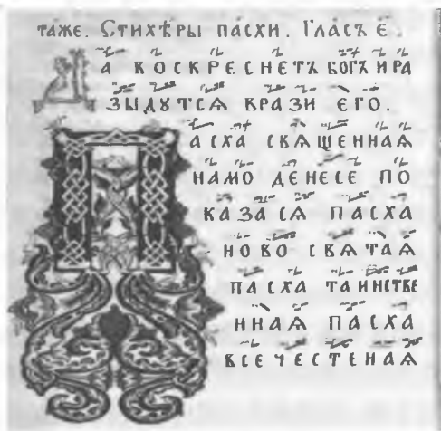
图3 传统的文字手稿

的手稿都具有此特点。经文歌词里的标记符号作为规范无牧师老信徒唱经传统。波洛茨克经文歌书的一个显著特点是存在多段式,固有的大部分内容为唱诗谱,少数为祭祀礼仪歌。这表明无论是独立片段,还是完整歌曲都多样存在(图3)。