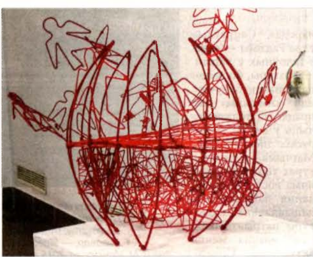
Галіна Санько «Цыркуляцыя».

Калі ўяўляеш скульптуру, то на розум спачатку прыходзяць аб'екты з цвёрдых альбо пластычных матэрыялаў. Але не менш актуальная тэкстыльная скульптура. У сталічнай мастацкай галерэі «Універсітэт культуры» прадстаўлена выстаўка па выніках V Міжнароднага італьянска-беларускага пленэру «Дыялог скульптур. Чырвонае. Чорнае. Італьянскі экзерсіс», дзе скульптура з тканіны дэманструе неверагодныя асаблівасці і магчымасці.