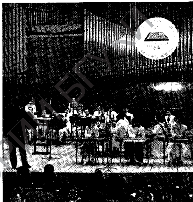
Выступленне лаўрэатаў конкурсу на заключным канцэрце.

цыялістаў, як І. Яраш, якая, дарэчы, на апошнім міжнародным конкурсе ў Клінгенталі заняла другое месца. І таму такі вынік конкурсу лічу натуральным: у баяністаў усё ж ёсць добры падмурак і багатае поле для дзейнасці. Яны маюць магчымасць выйсці на ўсесаюзныя і міжнародныя конкурсы. Такой перспектывы ў прадстаўнікоў іншых спецыяльнасцяў амаль няма. І нашы выхаванцы пачалі ўсё смялей заяўляць пра сябе на гэтых конкурсах. Так, І. Шэлег удзельнічаў у міжнародным конкурсе ў Клінгенталі, М. Слюсар стала дыпламантам Маскоўскага міжнароднага конкурсу.