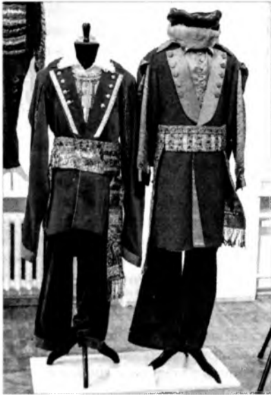
Ю. Пісун. Сцэнічныя касцюмы ансамбля «Песняры».

1 Што? У творчым праекце «Уладзімір Мулявін. Спадчына вялікага маэстра», арганізаваным Нацыянальным гістарычным музеем, Музеем Уладзіміра Мулявіна Беларускай дзяржаўнай філармоніі і Беларускаім дзяржаўным ансамблем «Песняры», прадстаўлены касцюмы і эскізы сцэнічных касцюмаў Галіны Крываблочки і Валянціны Барглавай з розных перыядаў існавання аднаго з найвядомейшых беларускіх асамбляў. Тут прадстаўлены шляхецкі, беларускі народны і афіцыйны касцюм з васільком. Асобнае месца займаюць джынсавы ўбор Уладзіміра Мулявіна і шэсць малюнкаў касцюмаў для канцэртаў у Амерыцы.