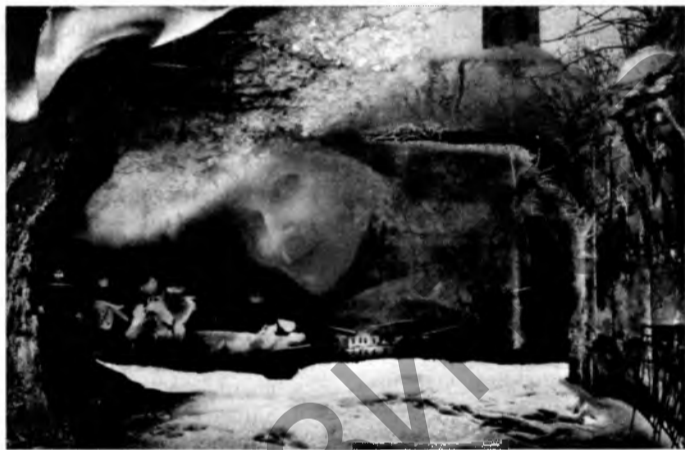
«Тэатр Ядвігі. Л.».

Чаму ісці? Творы Ганны Сілівончык мастацтвазнаўцы называюць святочнымі. І сапраўды, яе карціны здольныя ўзняць настрой, зацікавіць тэматыкай, колеравым рашэннем. А яе іронія, лёгкая і ўзрушальная, як сцвярджае сама аўтарка, раскрывае пачуццёвы рамантызм душэўных перажыванняў. Такі праект дазваляе ў поўнай меры адчуць вясну і яе прыродны водар.