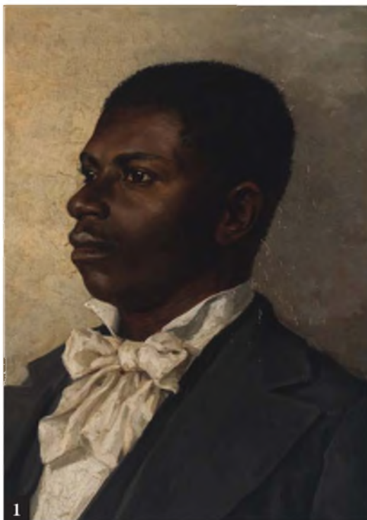
Рис. 1. Портрет темнокожего. Холст, масло, 52х41 см. Национальный художественный музей Литвы (Т-1344)