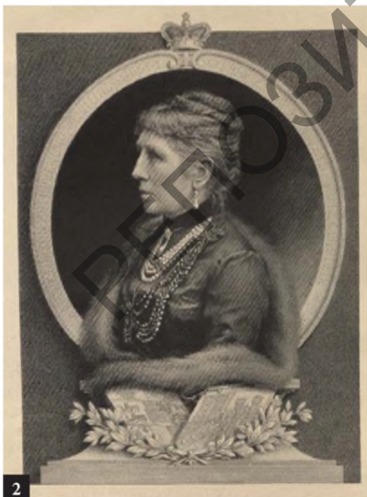
Рис. 2. Портрет княгини Марии Гогенлоэ-Шиллингсфюрст, урожд. княжны Витгенштейн. Литография с гравюры. Коллекция музея «Замковый комплекс “Мир”»