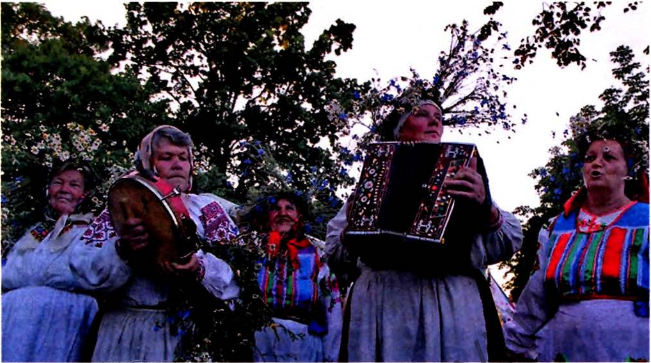
Выступы ў пасёлку Акцябрскі падчас леташняга фестывалю.