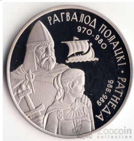
Малюнак 2 – Рагвалод і Рагнеда

На фрэсках царквы Спаса ў Полацку збераглася выява Еўфрасінні. Позірк асветніцы скіраваны ў будучыню, пра якую яна марыла, пачынаючы нашу кніжную традыцыю, ствараючы падмурак культуры. З імемем Еўфрасінні Полацкай звязаны крыж, зроблены па яе заказе ў 1661 годзе полацкім майстрам Лазарам Богшам. Крыж Еўфрасінні не толькі ўнікальны твор ювелірнага мастацтва, ён мае і поўную прыгоду гісторыю. Еўфрасіння Полацкая адкрывае шэраг постацей, якія упрыгожваюць нашу гісторыю, даюць узор шчырай любові да Айчыны, да ведаў, да чалавека. У бязлістаснае XII стагоддзе, калі князі вялі крывавае барацьбу за ўладу, у гэты дзікі час тыранічнага свавольства ўладароў і страты сумлення Полацкая зямля ўздавала такую велічную асобу, як Еўфрасіння [5].