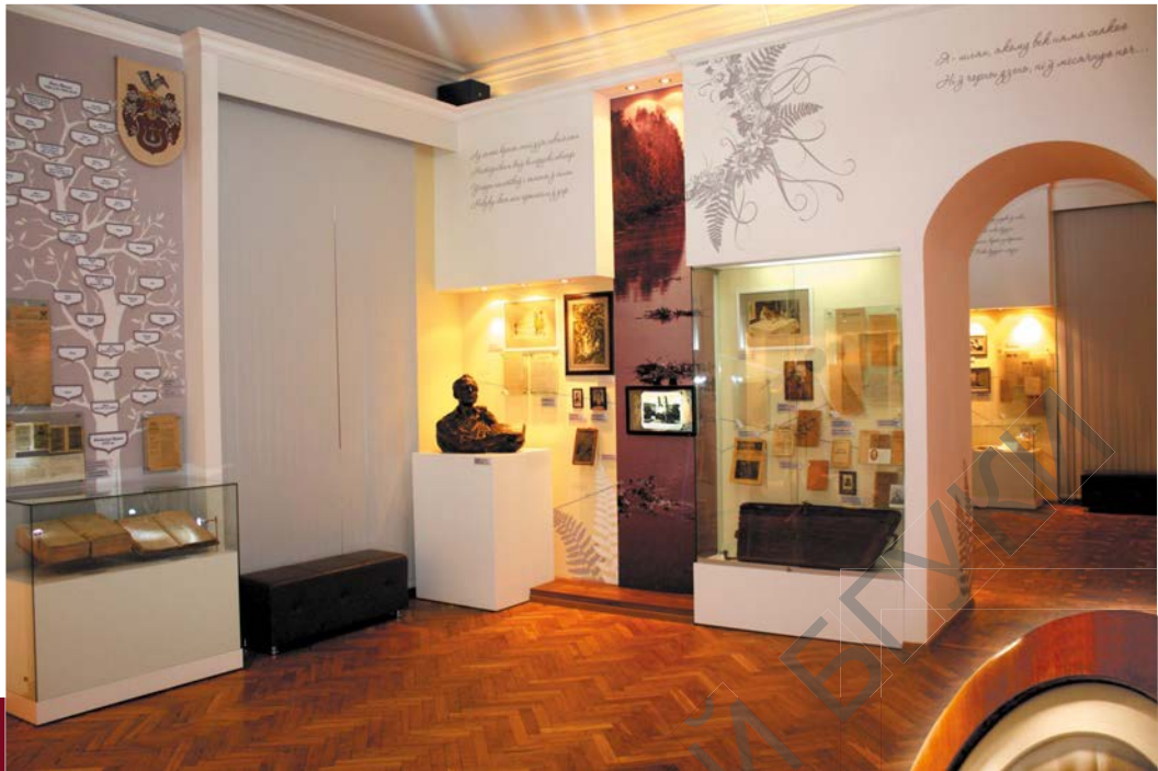
1-я зала. Тэма: «Роднай нівы я мільённая часціна... Вытокі»

Фатаграфія Янкі Купалы з жонкай У. Луцэвіч. 1916 г.