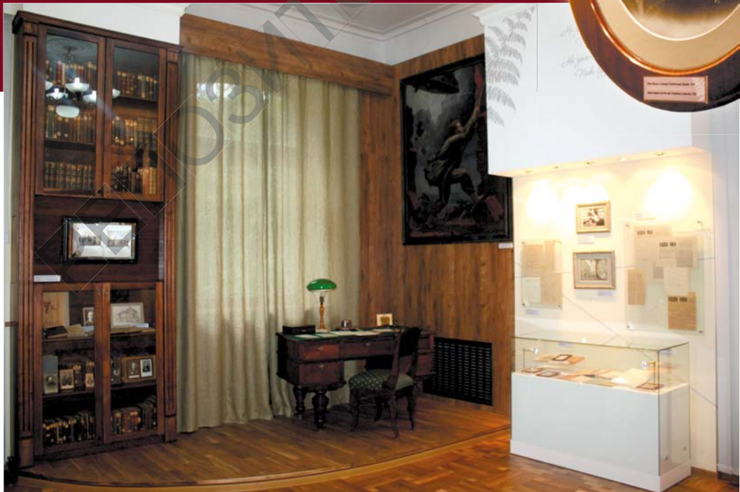
2-я зала. Рэканструкцыя рабочага месца Янкі Купалы ў бібліятэцы «Веды» ў Вільні

Фатаграфія Янкі Купалы з жонкай У. Луцэвіч. 1916 г.