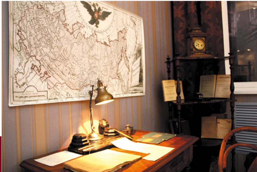
3-я зала. Рэканструкцыя пакоя Янкі Купалы на кватэры Б. Эпімаха-Шыпілы ў Санкт-Пецярбургу