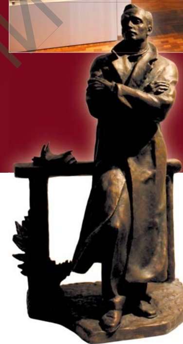
Праект помніка. Янка Купала ў Маскве. Аўтары: Л. Гумілеўскі і С. Гумілеўскі