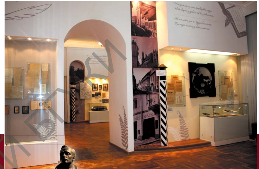
2-я зала. Тэма: «Вільня ў жыцці і творчасці Янкі Купалы»