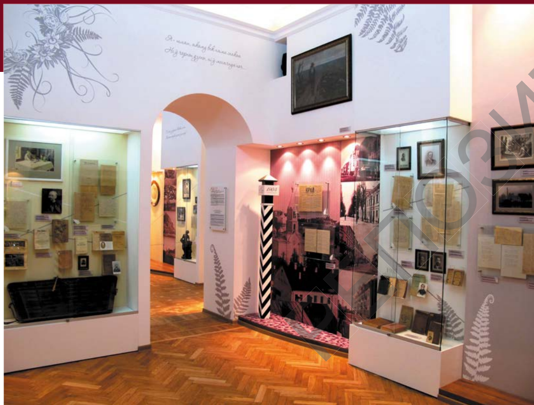
1-я зала. Тэма: «Пачатак літаратурнага шляху: ад «Северо-Западного края» да «Нашай Нівы»»