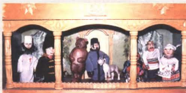
У “трупі” — больш за 30 драўляных акцёраў.