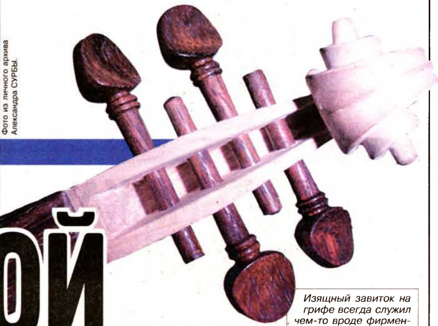
Изящный завиток на грифе всегда служил чем-то вроде фирменного знака скрипичного мастера.