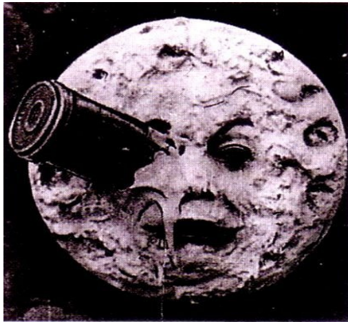
LE VOYAGE DANS LA LUNE

В период деятельности братьев Люмьеров кинематографом заинтересовался директор одного из парижских театров Жорж Мельес.