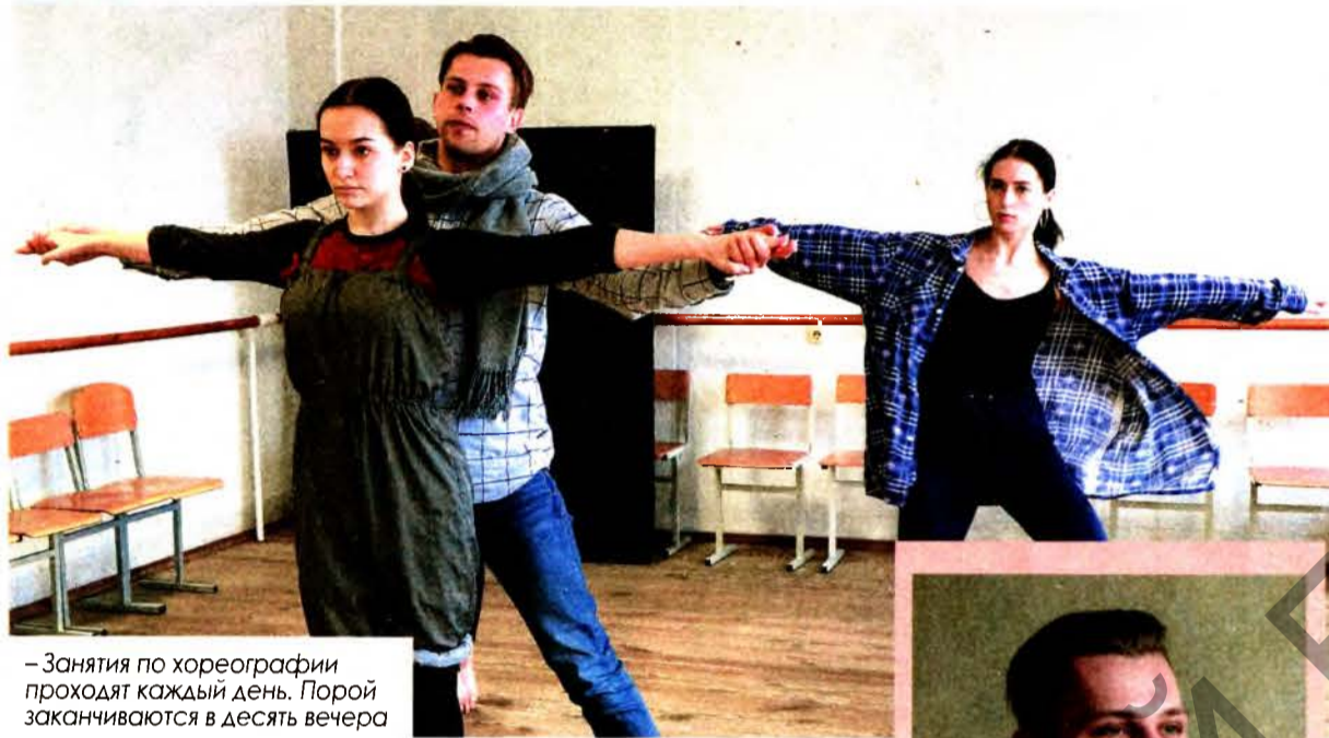
– Занятия по хореографии проходят каждый день. Порой заканчиваются в десять вечера