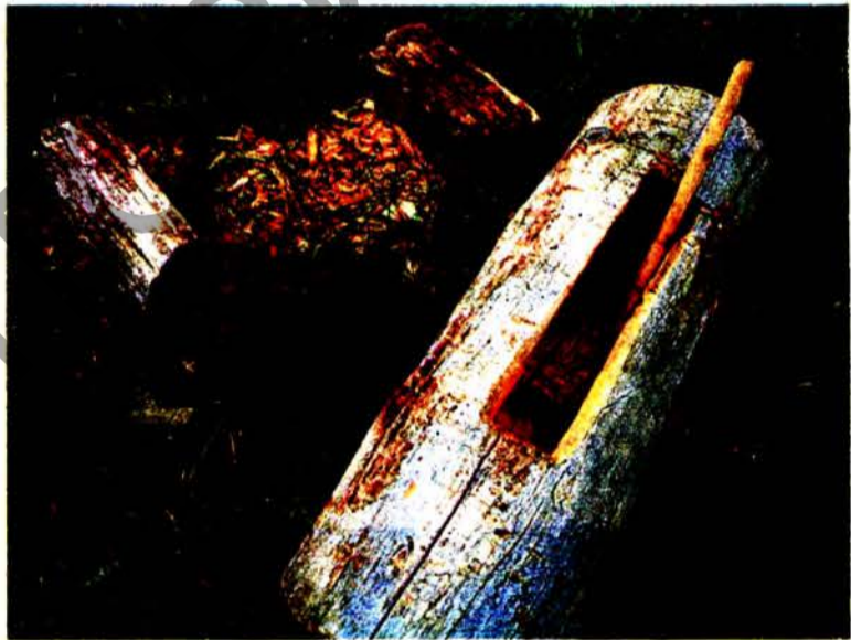
У Беларусі дасюль жывыя традыцыі бортніцтва.

тэрыяльнай спадчыны. Галоўная з іх — ігнараванне культурнага кантэксту, якое вядзе да дэградацыі элементаў спадчыны. Тыповы прыклад — традыцыя прыбіраць магілы на Радаўніцу і пакідаць пасля сябе на могілках безліч пластыкавых штучных кветак — а яны, як вядома, засмечваюць прыроднае асяроддзе і не перапрацоўваюцца на працягу доўгіх гадоў, што зусім не на карысць экалогіі. Таксама як прыклад экалагічнай і адначасова культурнай праблемы была згаданая сітуацыя з Блакітнай крыніцай у Слаўгарадскім раёне Магілёўскай вобласці, якая пачала прыцягваць увагу вялікай колькасці наведвальнікаў, а яны не заўжды паводзяцца належным чынам.