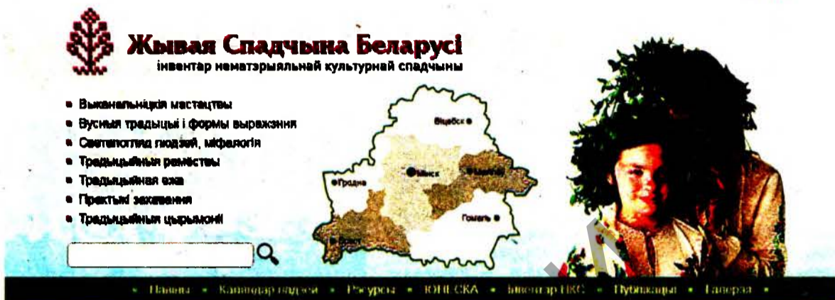
Сайт інвентара нематэрыяльнай культурнай спадчыны “Жывая спадчына Беларусі”.

Ала Шашкевіч таксама распавяла пра рызык і пагрозы, з якімі сёння можа сутыкнуцца нема-