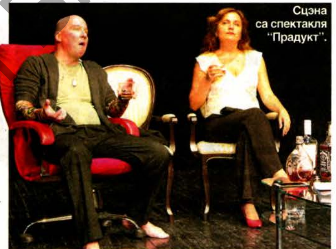
Сцэна са спектакля “Прадукт”.

У Брэсце завяршыўся XXIV Міжнародны тэатральны фестываль “Белая Вежа”. Ён працягваўся больш за тыдзень, складаўся з 28-мі спектакляў 13-ці краін свету, паказаных на пяці пляцоўках. А таксама ўключыў штотдзённыя аналітычныя абмеркаванні ўбачанага з запрошанай інтэрнацыянальнай камандай тэатральных крытыкаў, удзельнікамі і журналістамі. Такі фармат, прыняты на многіх прэстыжных форумах, дазволіў у атмасферы абсалютнай празрыстасці вылучыць лепшыя тэатральныя работы, сярод якіх аказаўся і прэм’ерны спектакль “Сотнікаў” Брэсцкага тэатра лялек.