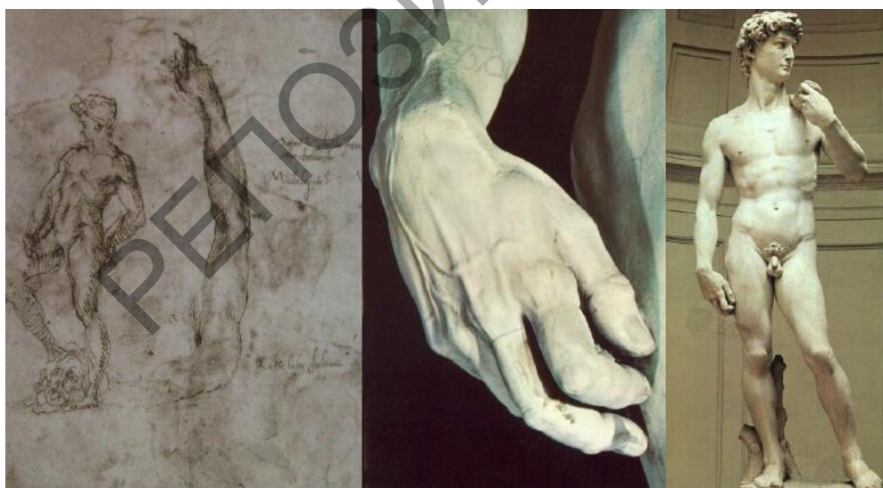
Рис. 2. Микеланджело «Давид»