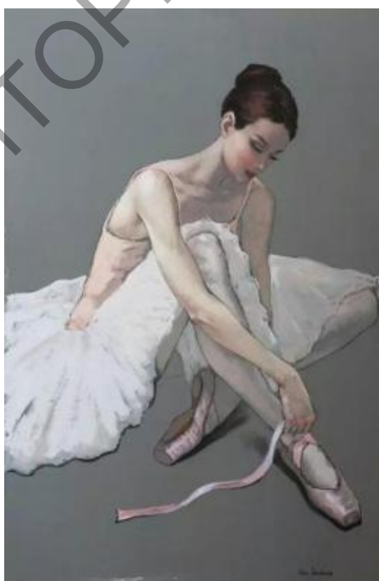
Рис. 4. Эдгар Дега «Балерина»