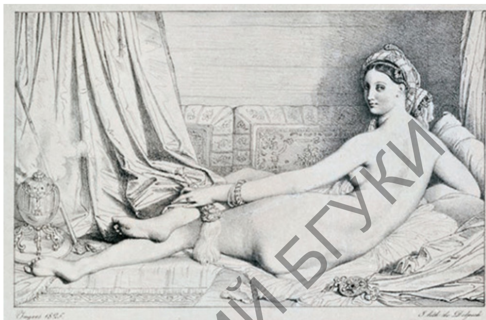
Рис. 3. Жан Энгр «Большая одалиска»