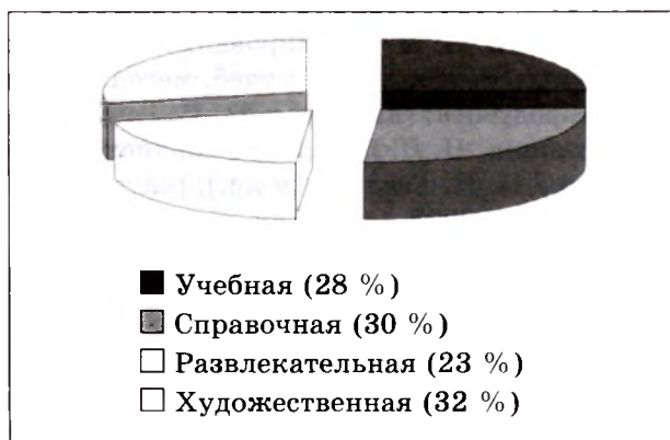
Рисунок 3 — Ответы респондентов на вопрос «Какой литературы, на твой взгляд, не хватает в фонде библиотеки твоей школы?»