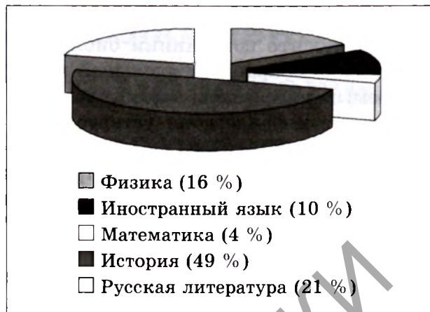
Рисунок 1 — Ответы респондентов на вопрос «По каким предметам/темам ты любишь читать литературу в свободное от учёбы время?»

Одной из причин недостатка в фонде библиотеки литературы, необходимой пользователям-учащимся, несомненно, является нехватка финансовых средств на приобретение в требуемом количестве но-