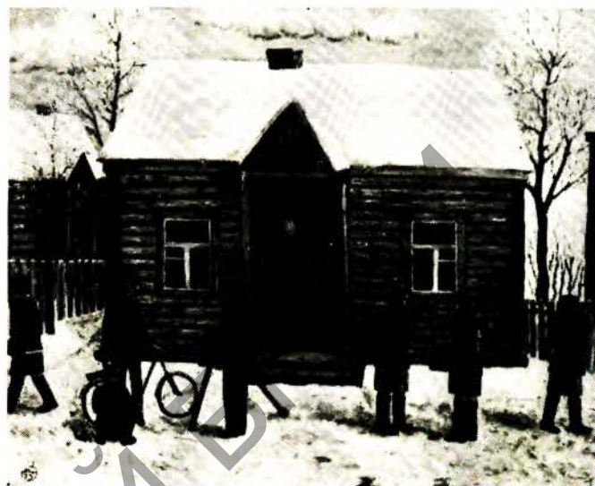
Калі магазіна. Алей, 1975

зак і копаў сена спацыруюць буслы. «Ружовую раніцу» можна лічыць і жанравай карцінай. Дзяўчынка нібы ўздымае заслону, і перад нашымі вачыма адкрываецца карціна абуджэння прыроды ад начнога сну.