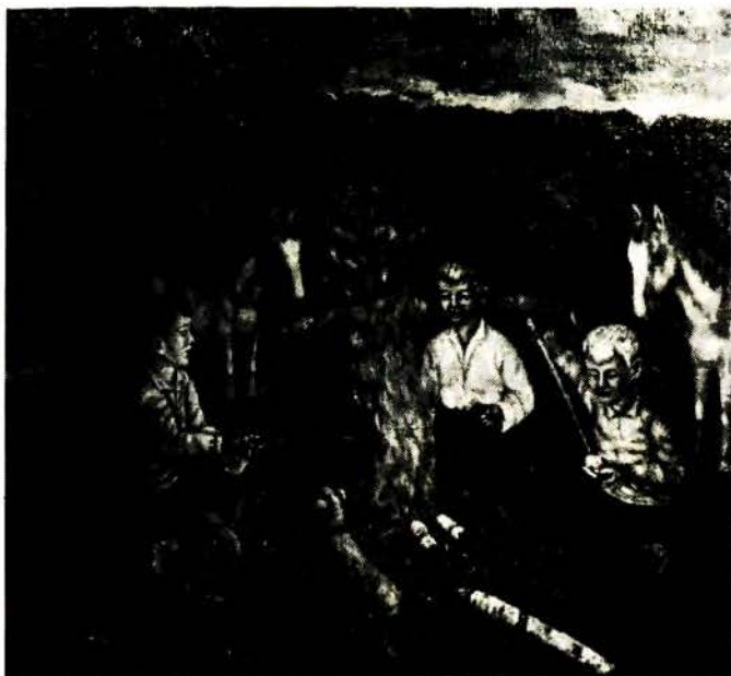
На начлег. Алей, 1971.