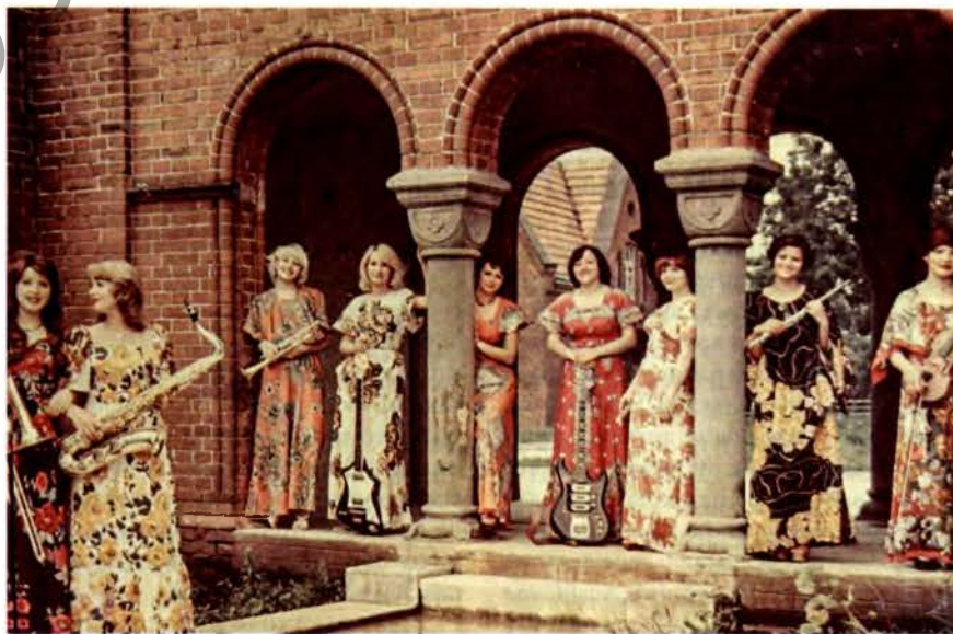
Першы склад гурту «Чараўніцы». 1977 год.