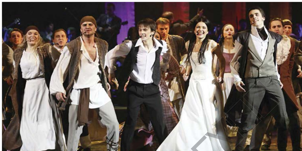
Сцена из спектакля «Дубровский»