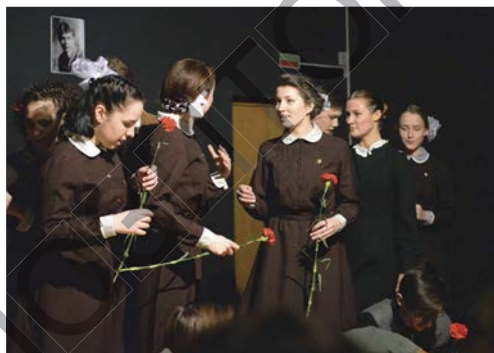
Сцена из спектакля «Завтра была война»