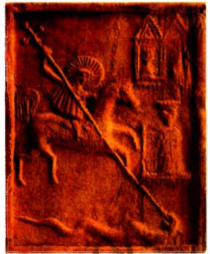
Кафля з Тупічэўскага манастыра

Кафлі з Магілёва і Мсціслава (першая палова — сярэдзіна XVII ст.) вылучаюцца барокавай трактоўкай сюжэту. Найбольш арыгінальная мсціслаўская кафля. Выява асілка на кані, які дзідай забівае цмока і вызваляе з палону прыгажуню-царэўну, мае непасрэдныя аналагі ў беларускім жывапісе XVIII ст. і народнай батлейцы XIX ст. Гэты сюжэт вядомы толькі з раскопак у Тупічэўскім манастыры. Гэта непаліваная кафля, вонкавая пласціна якой зроблена ў драўлянай форме. Яе памер 23x18,5 см.