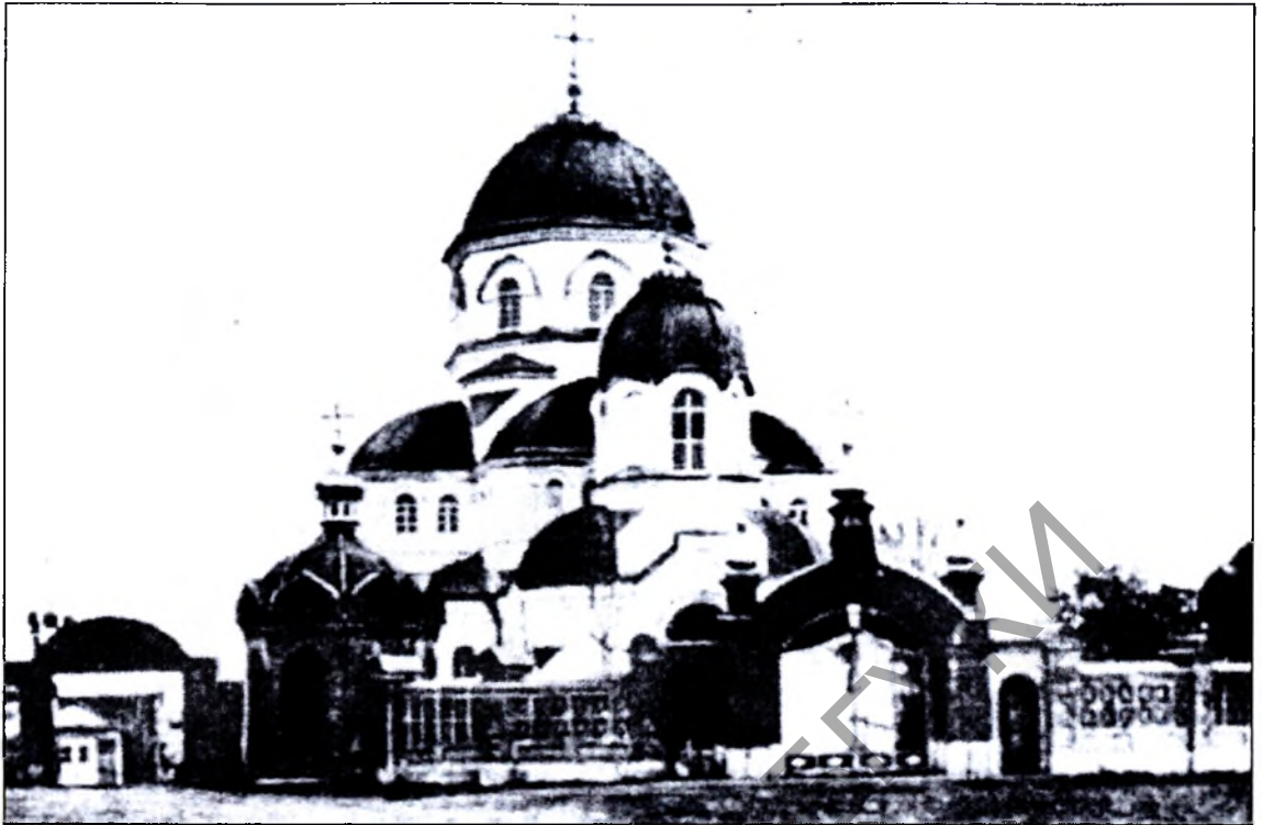
Сабор Тупічэўскага манастыра. XIX ст.

вучылішча, амбулаторыя з аптэкай. Жылыя і гаспадарчыя пабудовы былі ў асноўным драўляныя.