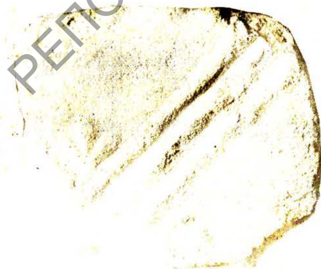
Фрагмент пліткі падлогі XIII ст. Знойдзена падчас рэстаўрацыі.