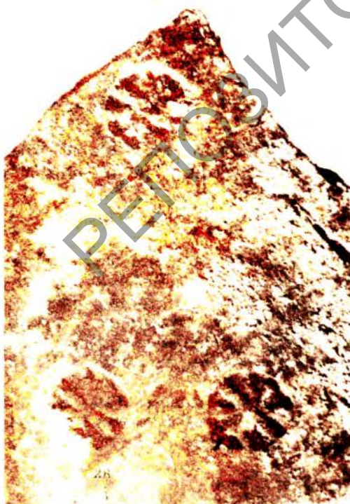
Бельчыцкі манастыр. Знакі на плінфе (раскопкі М. Каргера, 1965 г., архіўныя здымкі, друкуюцца ўпершыню).