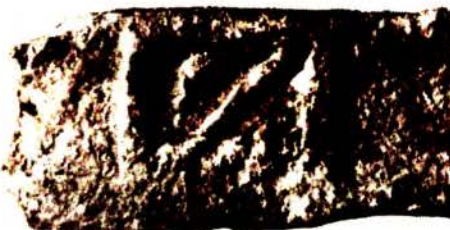
Бельчыцкі манастыр. Клеймы на плінфе (раскопкі М. Каргера, 1965 г., архіўны здымак).