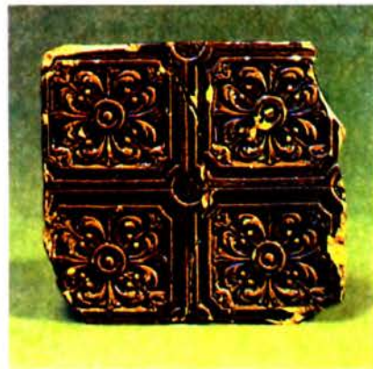
Да арт. Навагрудская кафля. Паліваная кафля з малюнкам дыванавага тыпу. 17 ст.

НАВАГРУДСКАЯ РАТУША. Існавала ў 17—19 ст. у г. Навагрудак Гродзенскай