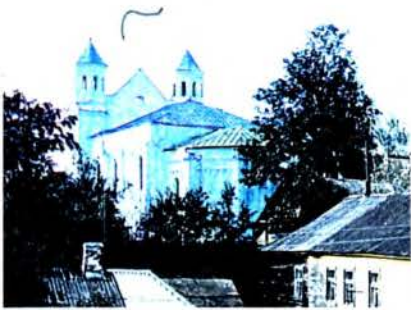
Навагрудская Барысаглебская царква. Выгляд з боку апсіды.

Літ. : Трусов О.А. Борисоглебская церковь XII в. из Новогрудка // Памятники старины. Концепции. Открытия. Версии. СПб., Псков, 1997. Т. 2. А.А.Трусов.