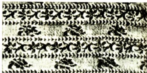
Гродзенскі пояс. Фрагмент. Музей старажытнабеларускай культуры ІМЭФ АН БССР.

ГРОДЗЕНСКІЯ ПАЯСЫ , вырабы Гродзенскай шаўкаткацкай мануфактуры А. Тызенгаўза (1770—88). Запрошаныя сюды франц. майстры ўзялі за аснову арнаментальную структуру, памер і кампазіцыйны падзел слуккіх паясоў , але арнамент сярэдняй часткі і матывы на канцах пояса распрацавалі паводле франц. узораў, якія пазней былі заменены на ўсходнія.