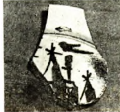
Мірскі фаянс. Фрагменты. 18 ст.