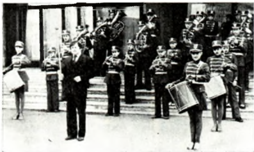
Полацкі ўзорны дзіцячы духавы аркестр «Арляня».