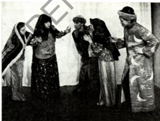
Полацкі ўзорны юнацкі театр-студыя. Сцена са спектакля «Казка пра цара Салтана».

У рэпертуары: «Беларуская калыханка» паводле В. Віткі, «У дзень з дажджом і градам» Г. Марчука, «Казка пра цара Салтана» паводле А. Пушкіна, «Любоў да трох апельсінаў» М. Святлова, «Дванаццаць месяцаў» С. Маршана, «Зорачка-Соня» Ф. Мільчынскага, «Выкрадальнікі цудаў» Л. Усці-