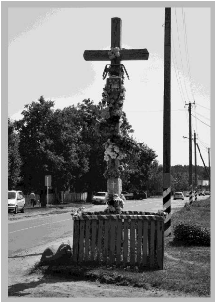
Малюнак 4 – Прыдарожны крыж «Пэтрык». Моталь. 2015 [2]

Як бачым, аўтэнтычная традыцыя прыкладання камянеў да крыжа, яго аздаблення і нават «мясцовая манера» літургічных спеваў захоўваецца стальмі маталанамі. Аднак існуюць праблемы, звязаныя з успрыманнем, неразуменнем моладдзю значнасці гэтай з’явы, дэмаграфіяй, прабеламі ў выхаванні, а таксама слабай інфармаванасцю і ўдзелам супольнасці. Сучасныя тэхналогіі дазваляюць паставіць надмагільны помнік, цалкам высечаны з каменю (у майстэрнях па іх вырабе паводле замоў родных і нашчадкаў нябожчыка, зыходзячы з іх фінансавага дабрабыту). І ўсё часцей назіраецца на такіх мясцовых надмагіллях а д с у т н а с ц ь каменя.