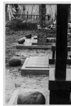
Малюнак 3 – Могілкі вёскі Моталь, 2015 [4]

Тэрыторыя Мотальскага мікрарэгіёна гістарычна ахоплівае сам Моталь і наваколле. У пачатку XX ст. у склад Мотальскага прыхода ўваходзілі яшчэ вёскі Капілы, Крывіца, Пнюхі, Песьшчава, Упірава, Тышкавічы. На працягу XX ст. у склад Моталі былі ўключаныя вёскі Заазер’е, Дзедавічы, Панцавічы. На іх могілках фіксуецца традыцыя «прыкладання каменя» да крыжа (мал. 2). Камень паводле прадстаўлення жыхароў служыць напамінам аб існаванні душы нябожчыка якая «прылятае пасядзец» на ім.