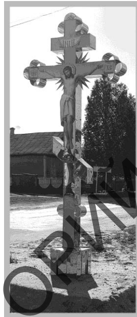
Малюнак 5 – Крыж «Пэтрык» абноўлены. Моталь. 2017 [2]