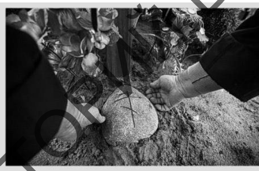
Малюнак 2 – Традыцыя «прыкладання каменя» да драўлянага крыжа на пахавальным узгорку, насыпаным над труной. Моталь, 2015 [4]