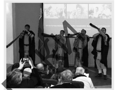
Малонак 3 – Ансамбль драўляных труб на адкрытым канферэнцыі «Аўтэнтчны фальклор», кіраўнік – аўтар (2-гі справа). Мінск, 2016