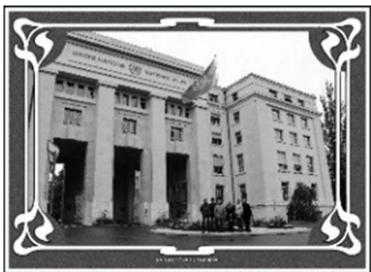
Мал. 4. Палац Нацый. Жэнева, 2017 г.