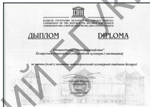
Мал. 10. Дыплом кафедры ад ЮНЕСКА за захаванне НКС, 2008 г.

У працэсе ўкаранення дадзенай мадэлі ў навучальны працэс БДУКМ дзейнасць кафедры набыла дасканалую форму і яна «адбылася» як кафедра сучаснай практычнай фалькларыстыкі. Як прыклад паспяховасці этнамастацкай адукацыі кафедры этналогіі і фальклору БДУКМ можна прывесці выпуск спецыялізацыі «Этнафоназнаўства» 2013 г., навукова-даследчыя дыпломныя работы якога (выкананыя на падставе ўзгаданай вышэй мадэлі) атрымалі выключна прызавыя катэгорыі: першую (3 работы) і другую (1 работа) на прэсціжным Рэспубліканскім конкурсе навуковых работ студэнтаў. А чатыры іх аўтары (100 % ад гадавога выпуску спецыялізацыі) сталі магістрантамі Інстытута падрыхтоўкі навуковых кадраў Нацыянальнай акадэміі навук Беларусі. Маркер творчых поспехаў этнафоназнаўцаў БДУКМ – шматлікія дыпломы міжнародных фальклорных фестываляў, а таксама спецыяльныя дыпломы Фонда Прэзідэнта Рэспублікі Беларусь па падтрымцы творчай моладзі, якія атрымалі фальклорныя ансамблі кафедры