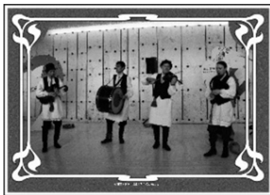
Мал. 5. «Vietakh» у Палацы Нацый. Жэнева, 2017 г.