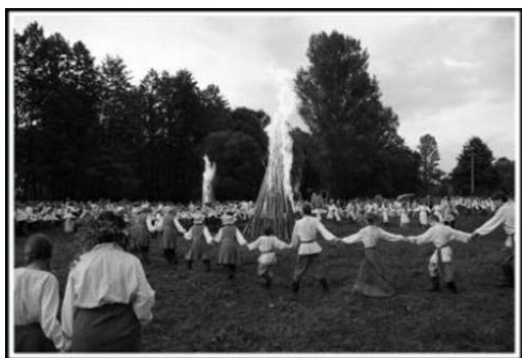
Мал. 9. Рэвіталізацыя Купалля як дыпломны праект этнафоназнаўцаў, 2012 г.