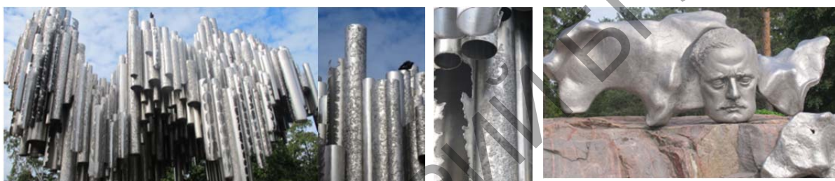
Рис. 1. Эйла Хилтунен. Sibelius Monument (1967 г., нержавеющая сталь, высота 8,5 м, длина 10,5 м, глубина 6,5 м)

Musicae («Страсть к музыке») [2]. Форма этого абстрактного памятника напоминает объемное изображение звуковой волны, образованной рядами органных труб, сваренных вместе. Для создания памятника скульптору понадобилось более 600 полых стальных труб. Неравномерно сгруппированные на разной высоте трубы имеют текстуру, напоминающую березовое дерево, причем текстуровка была выполнена Эйлой Хилтунен вручную. По проекту художницы памятник должен был воплотить дух музыки Я. Сибелиуса, который стремился к активному постижению, восприятию (но не осмыслению) природы, служившей для него во всей своей сложной чувственности источником вдохновения. Друзья называли композитора мечтателем и поэтом природы [3, с. 78].