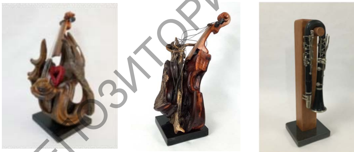
Рис. 3. Филипп Гильерм. (слева) Душа музыки II (2020 г., дрейфующая древесина с Багамских островов, орех, клен, 60,96 x 38,1 x 38,1 см); (в центре) Импровизация природы (2020 г., дрейфующая древесина с Багамских островов, орех, клен, вишня, 55,88 x 43,18 x 25,4 см); (справа) Возвращение кларнета (2020 г., вишня, кларнет, медь, 58,42 x 17,78 x 17,78 см)

Музыкальные скульптуры Филиппа Гильерма отличаются плавными очертаниями силуэта, мягким круглящимся рельефом, который воспринимается как визуальное воплощение гладкости, легкости, естественности мелодического движения (см. рис. 3). «Искусство и музыка – более прямые языки, чем сказанные или написанные слова, и мои скульптуры поют. Я всегда хотел послать сообщение, которое было бы доступно всем», – так сам мастер высказался о своих работах, в которых тема музыки находит пластическое выражение [4].