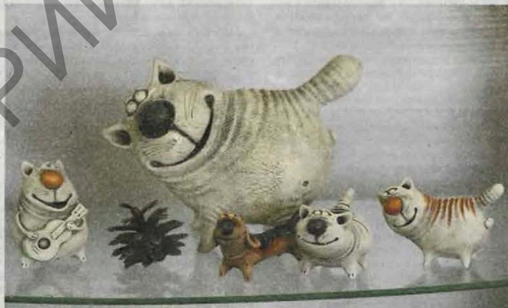
Керамічныя вырабы Міхаіла Бруя.

— Мастацкае афармленне якой кнігі беларускіх пісьменнікаў вы лічыце найболей удалым?