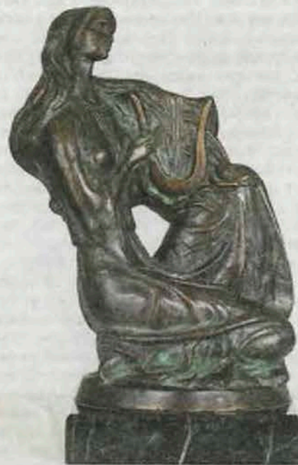
Скульптура Сяргея Гумілеўскага «Мелодыя».

экспазіцыі з прэзентацыямі кніжных выданняў у межах Мінскай міжнароднай кніжнай выстаўкі-кірмашу і ў галерэі «Універсітэт культуры», і ў Нацыянальным гістарычным музеі. І заўсёды было цікава!